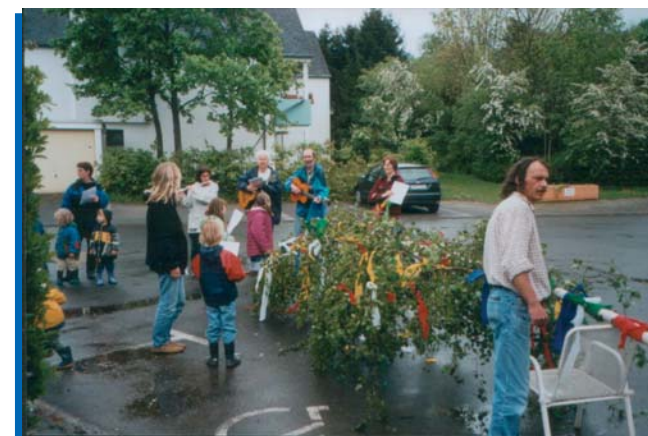
Gemeinsames Wohnen, gemeinsames Feiern der Bewohner mit Freunden und Besuchern

Auf Grundlage des intensiveren gemeinsamen Wohnens von Menschen mit unterschiedlicher Lebenslage und Lebensorientierung erweitert der Bewohner den eigenen menschlichen Erfahrungshorizont. In den gemeinsa-