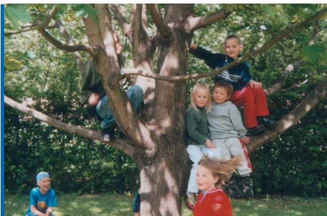
Zahlreiche Grünflächen im Wohngebiet

Die Abtei St. Matthias finanziert mit Unterstützung der Stadt Trier und des Landes Rheinland-Pfalz einen Sozialpädagogen, den so-