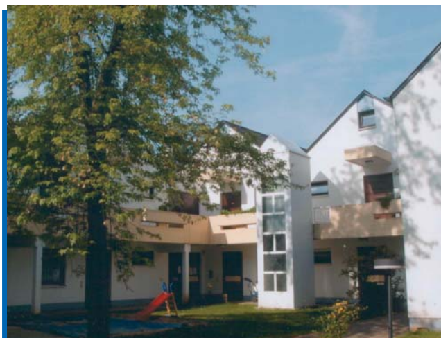
Blick in den Innenhof eines der Mehrfamilienhäuser im Schammatdorf mit Spielmöglichkeit für Kinder und Sitzgelegenheit für Nachbarn und Gäste/Besucher

Die Architektur ist vom ideellen Grundgedanken der Förderung der Kommunikation der Bewohner geprägt. Die Außenanlagen sind weitgehend rollstuhlfreundlich und zudem vielfältig begrünt. Die Mehrfamilienhäuser sind mit Innenhöfen und Laubengängen ausgestattet und geben den Bewohnern Überschaubarkeit, Treffpunkte und erhöhte Sicherheit. Es gibt 44 barrierefreie Wohnungen für Menschen mit Gehbehinderungen. Ebenfalls barrierefrei ist das in der Dorfmitte gelegene Schammatdorfzentrum, das den Nachbarn für ihre Aktivitäten zur Verfügung steht.