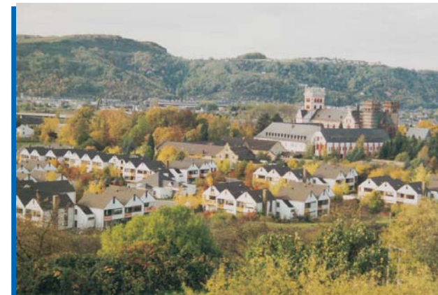
Das Schammatdorf, im Süden der Stadt Trier, im „Schatten“ der Abtei St. Matthias