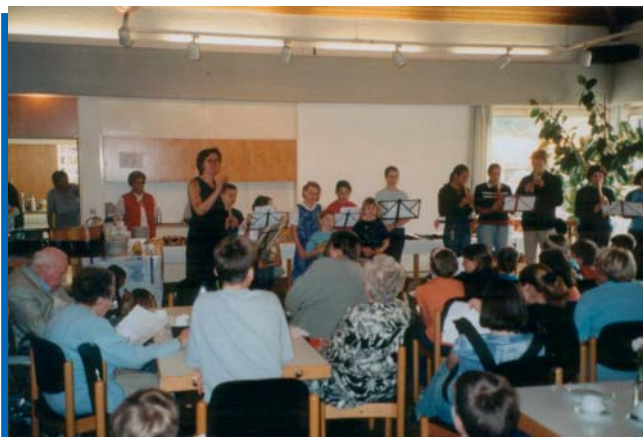
Zahlreiche Veranstaltungen finden alljährlich im Schammatdorf-Zentrum statt

men Aktivitäten in der Gestaltung der Wohnumwelt und in der Freizeit werden wechselseitige Anerkennung gefördert, persönliche Fähigkeiten zur selbstbestimmteren Lebensführung entwickelt und gegenseitige unentgeltliche Unterstützungen aufgebaut. Mit der Gründung eines Vereins haben die Nachbarn auch eine rechtlich verfasste Struktur zur Beteiligung an der Weiterentwicklung ihres Gemeinwesens geschaffen.